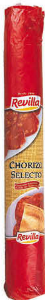
810200 XORIÇO SELECTE REVILLA Peça de ±1,35kg