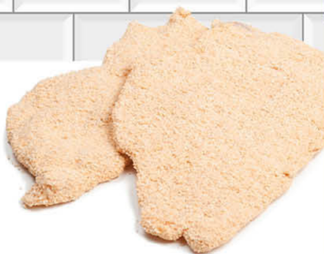
401142 PIT DE POLLASTRE EMPANAT Caixa de 3kg