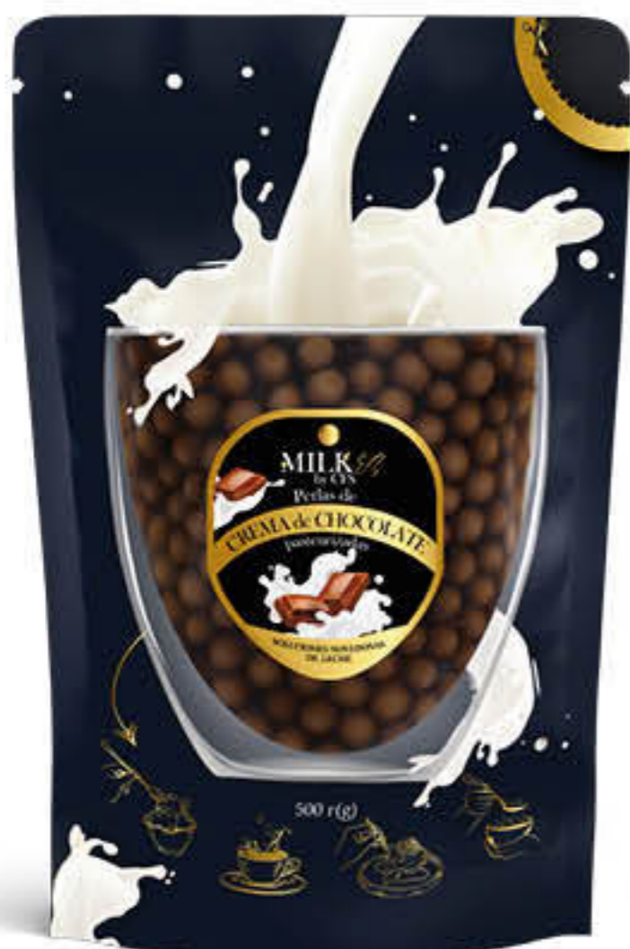
810998 DE CREMA DE XOCOLATA Bossa de 500g - Mida: 8mm