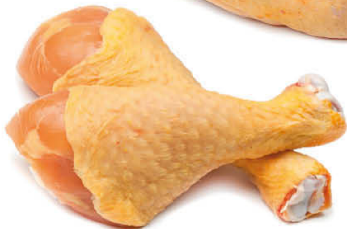
401160 PERNILETS DE POLLASTRE Caixa de 5kg Peces de 120/160g - IQF