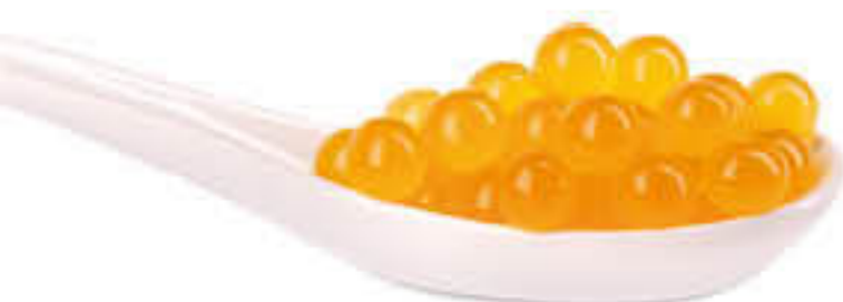
810994 DE MANGO Bossa de 500g - Mida: 8mm