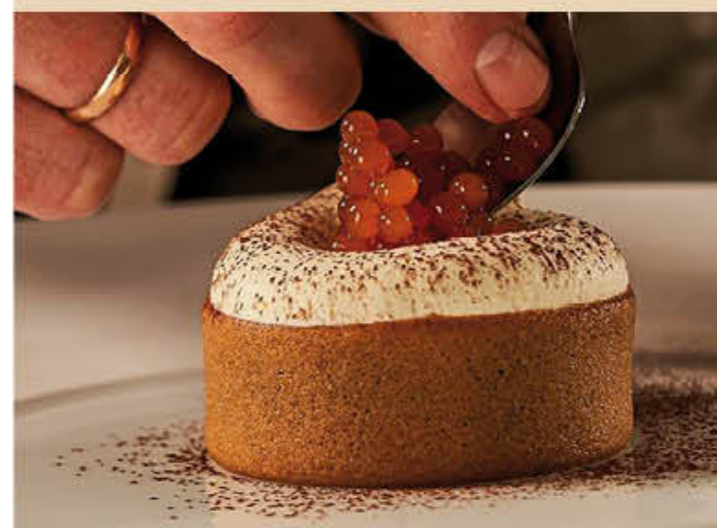
POSTRES I DECORACIONS