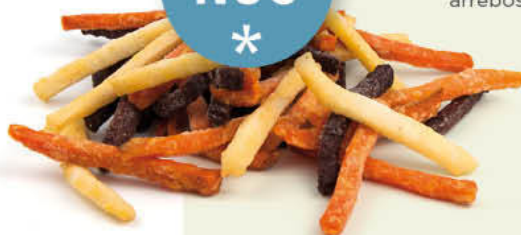
828 VEGGIE FRIES Bossa de 2,5kg - Tires de vegetals a base de pastanaga, remolatxa i xirivia, arrebossades i prefregides