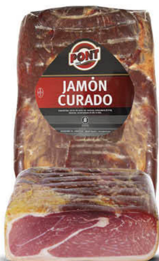
811003 PERNIL CURAT MOTLLE Peça de ±4,30kg