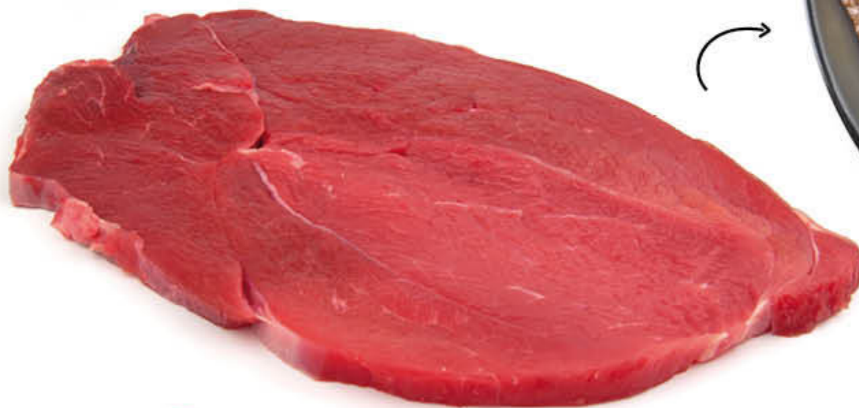
2621 BISTEC DE VEDELLA EXTRA Safata de ±2kg