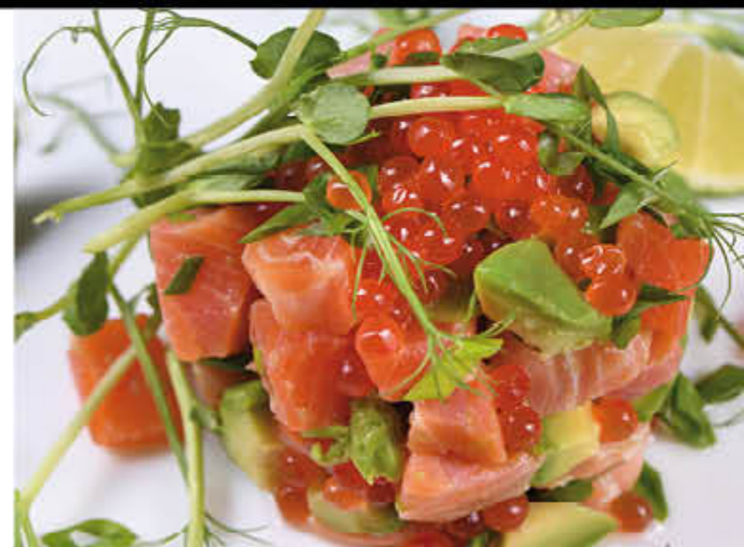
PEIX I MARISC