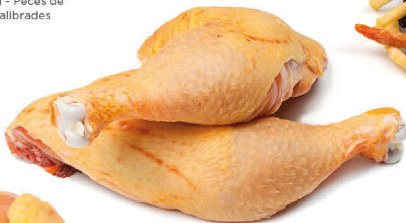
401125 QUART DE POLLASTRE Caixa de 5kg - Peces de 300/400g calibrades