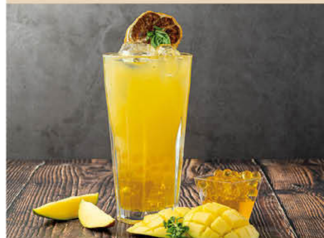
COCKTAILS, LICORS, BEGUDES, CAFÈS,...