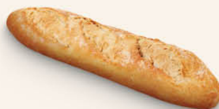
610007 MITJA PROVENÇAL Caixa de 65u de 120g