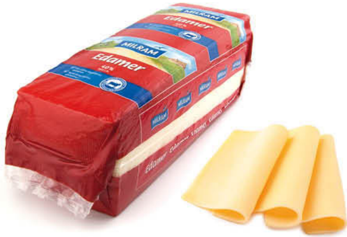
800565 FORMATGE EDAM BARRA Peça de ±3kg