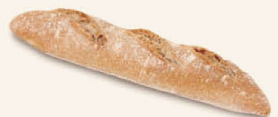
610269 MIG FLAUTÍ RÚSTIC Caixa de 80u de 75g