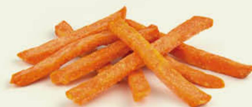
748 SWEET POTATO CRISPY Bossa de 2,5kg - Tall irregular