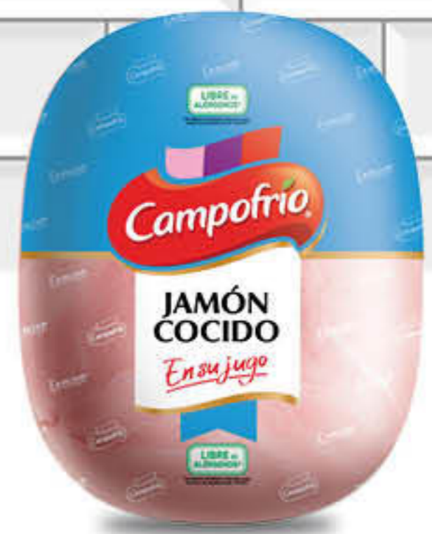
810156 PERNIL CUIT EXTRASUCÓS Peça de ±6kg