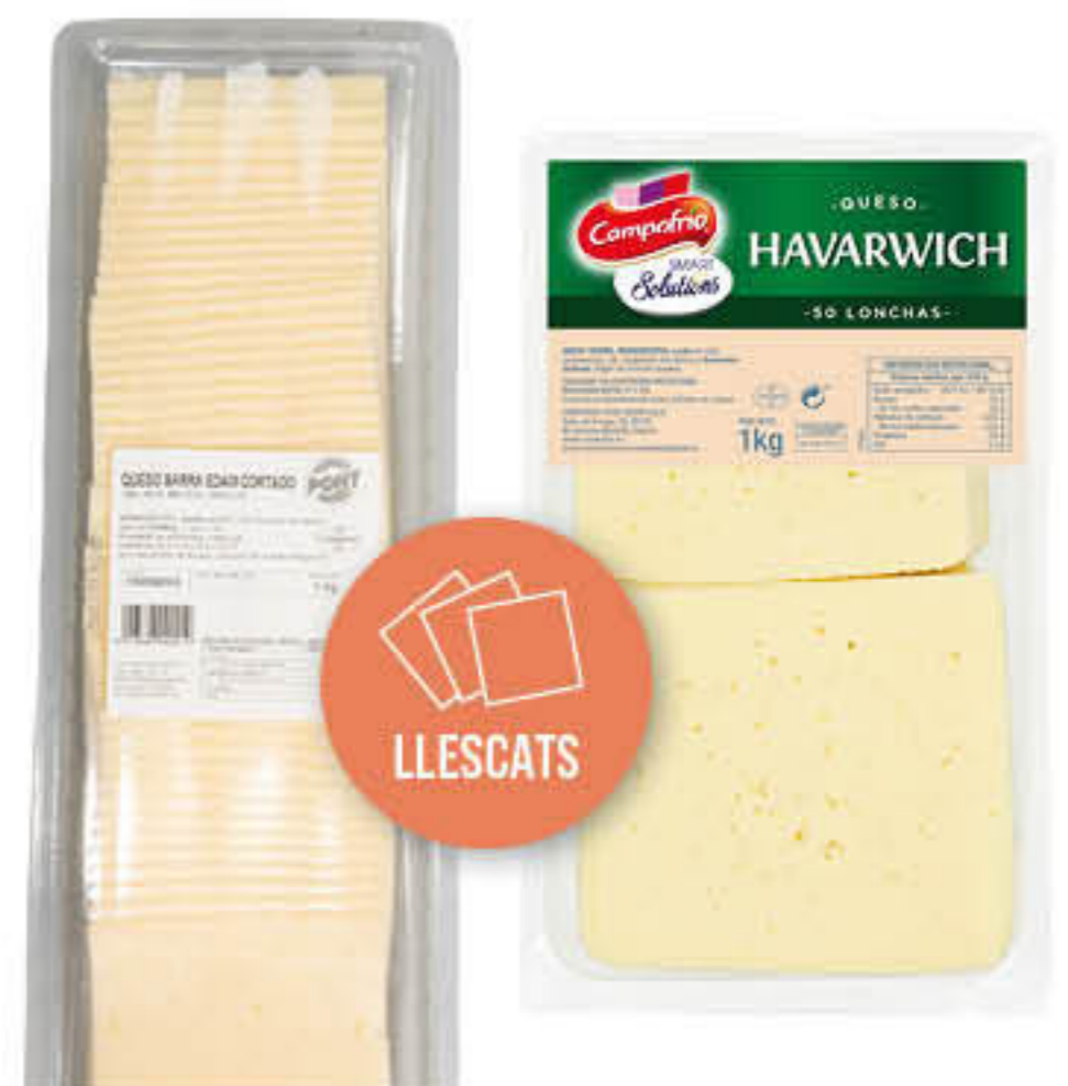
810347 FORMATGE HAVARTI LLESCAT Safata d'1kg - 50 talls