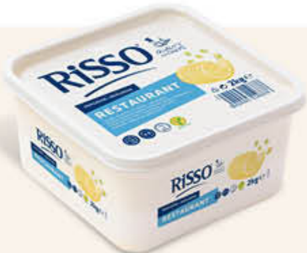
901160 MARGARINA RESTAURANT Tarrina de 2kg