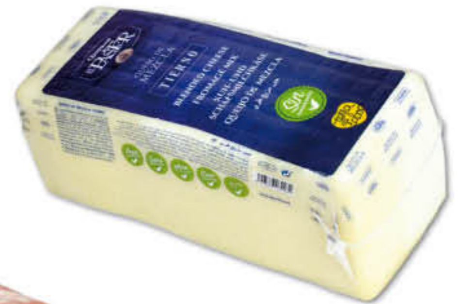
810396 FORMATGE MESCLA BARRA Peça de ±2,5kg