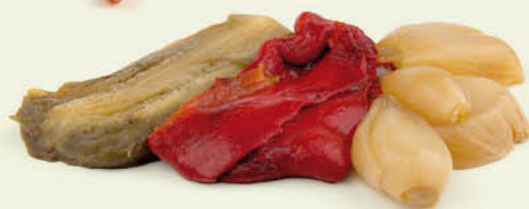
810814 ESCALIVADA EXTRA Safata d'1kg