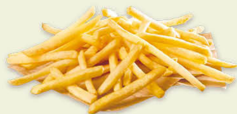
837 SURECRISP 6/6 Caixa de 5 bosses de 2,5kg - Tall 6x6mm. Mantenen la calor fins a 15 minuts més que les patates tradicionals, i l'arrebossat de midó de la mateixa patata les fa encara més cruixents