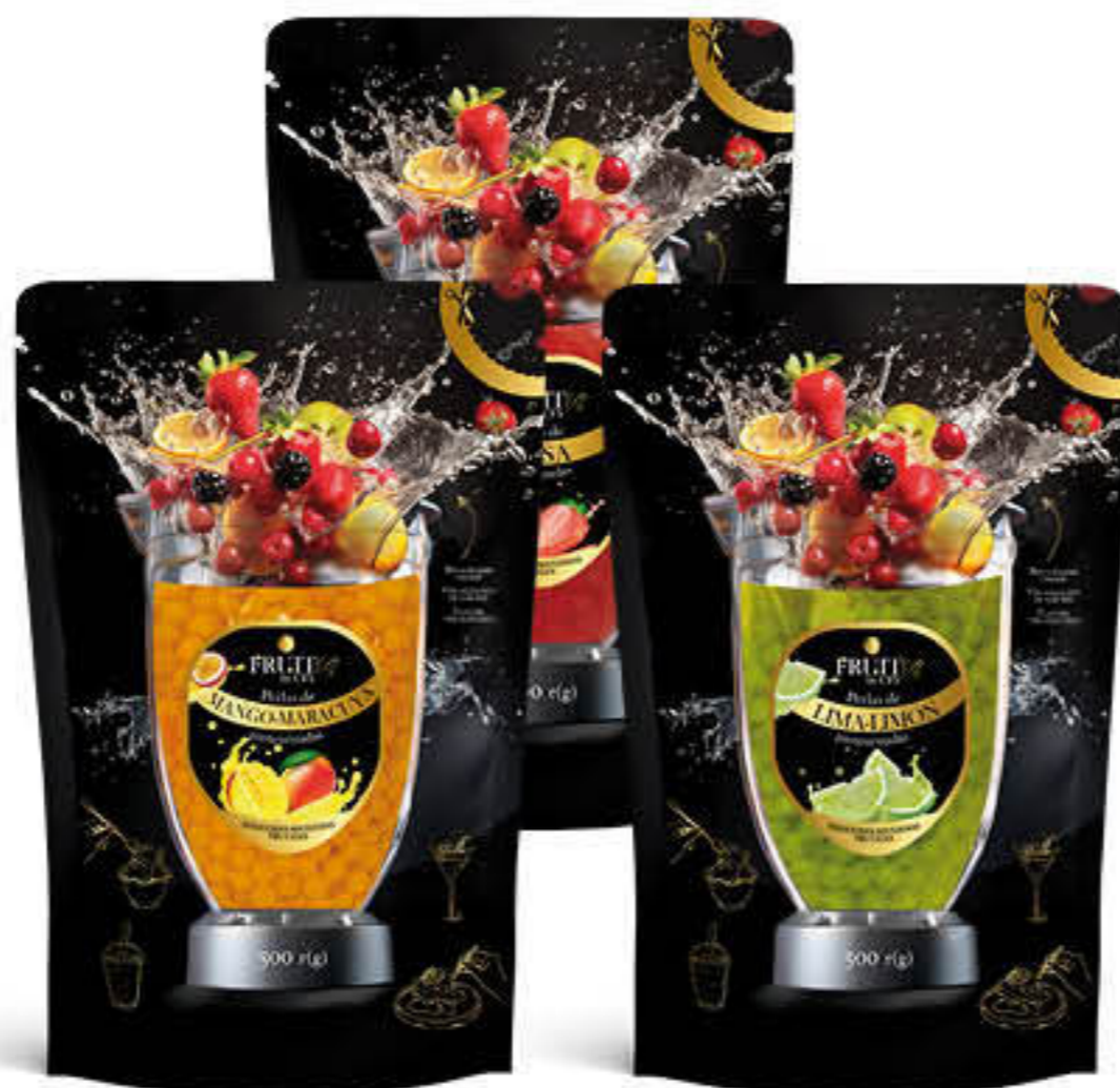
810996 DE MADUIXA Bossa de 500g - Mida: 8mm