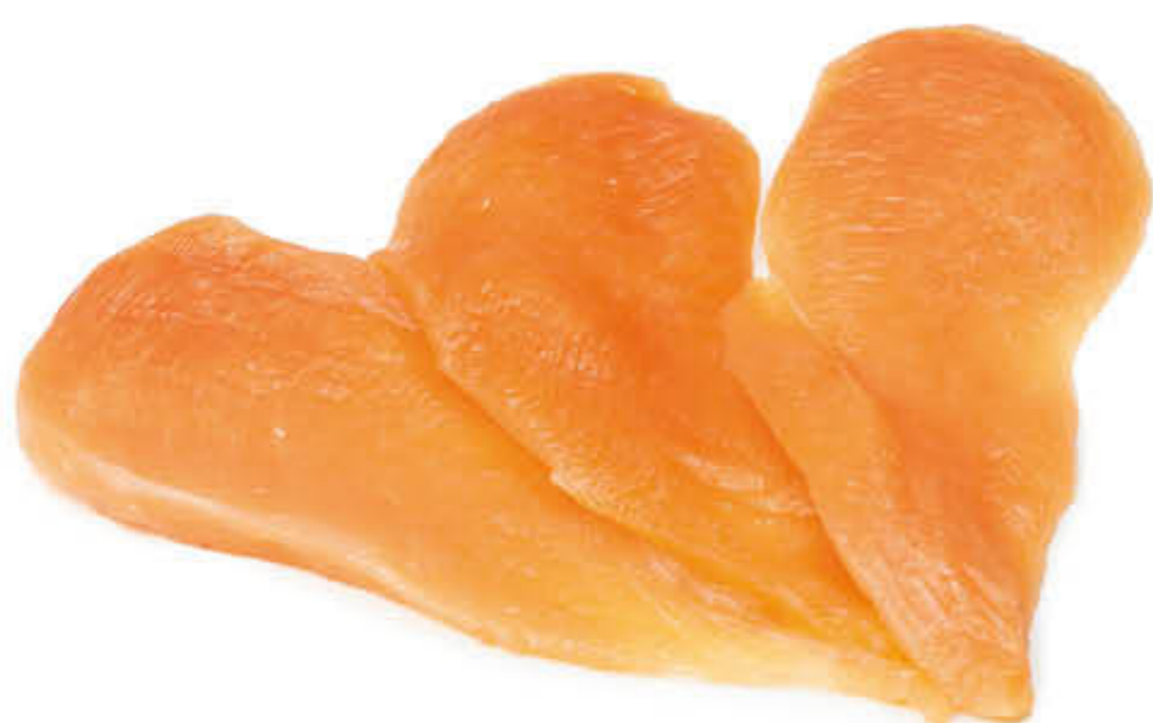
401158 PIT DE POLLASTRE FILETEJAT Caixa de ±6kg