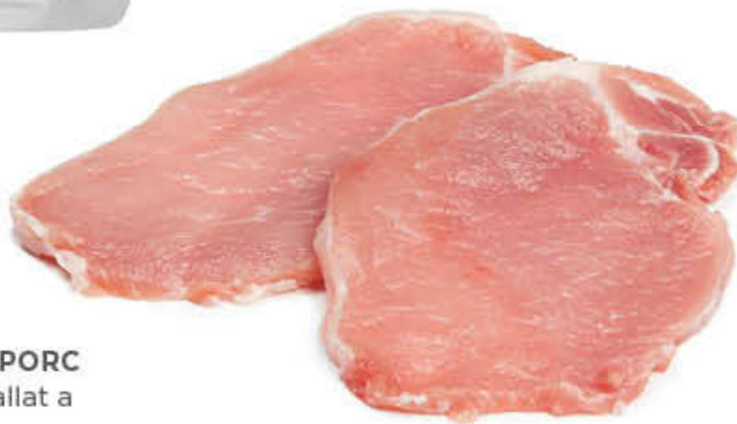
401225 LLOM DE PORC Caixa de ±5kg - Tallat a 5mm sense cordó