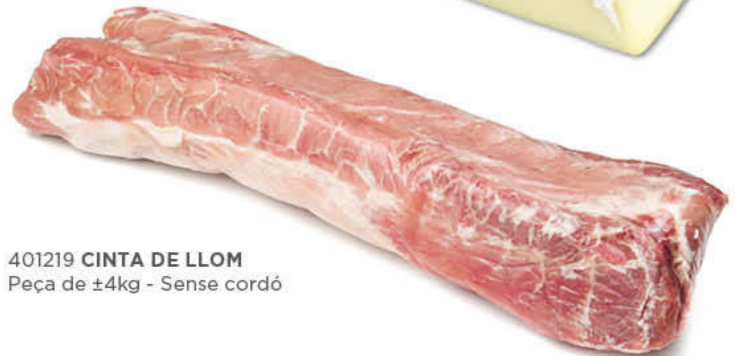
401219 CINTA DE LLOM Peça de ±4kg - Sense cordó