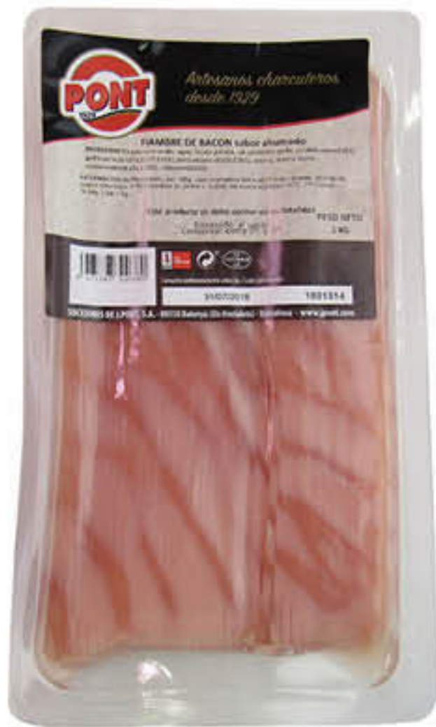
811025 FIAMBRE DE BACON FUMAT LLESCAT Safata d'1kg