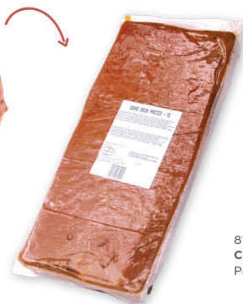
810050 CENTRE PERNIL CURAT NAVI G.REN Peça de ±4,5kg