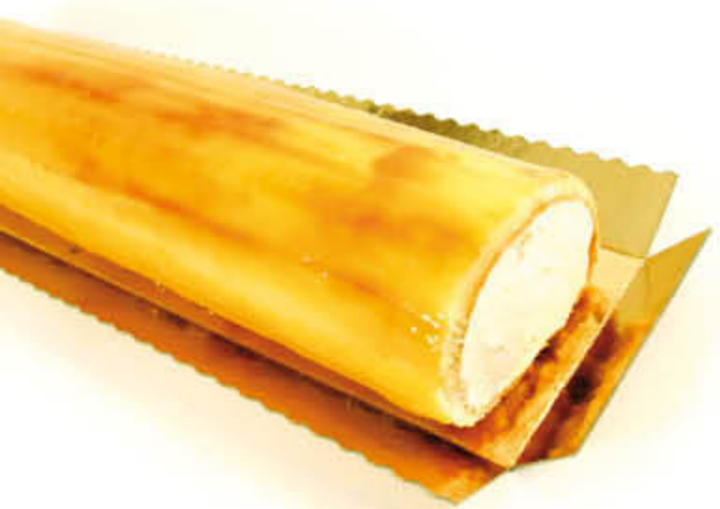
300555 BRAÇ CREMAT DE NATA Caixa de 2u de 500g