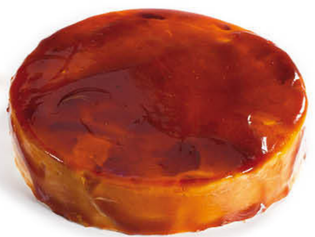
300521 PASTÍS DE GALETA I CAMEL Pastís de 1.500g - 12 racions