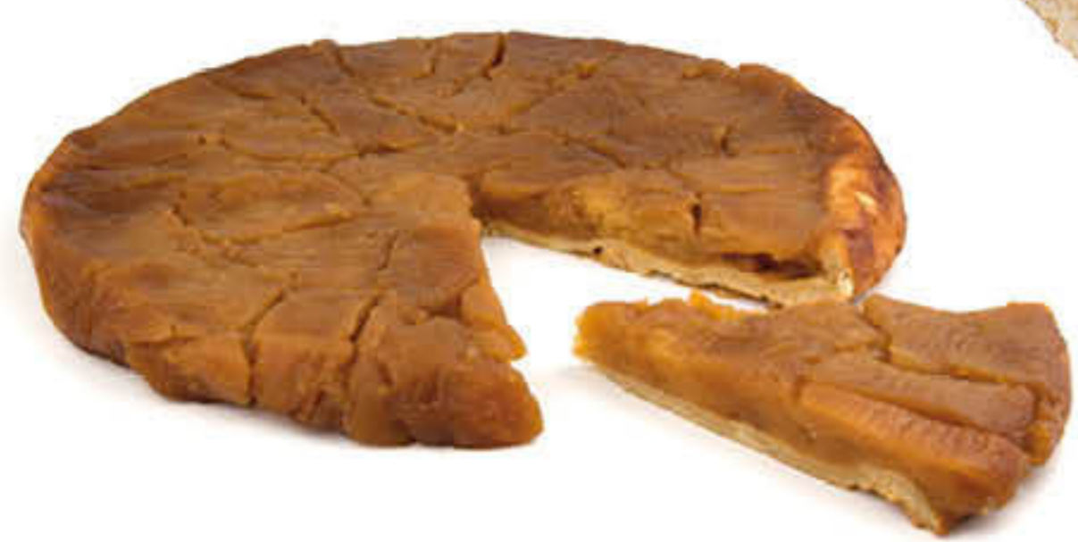
300585 TATIN DEL MOOMA Pastís de 1.700g - 12 racions