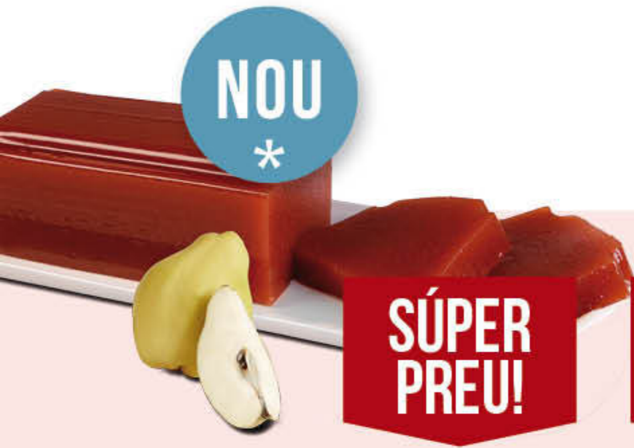
800653 CONDONY ARTESÀ Barra de 3kg