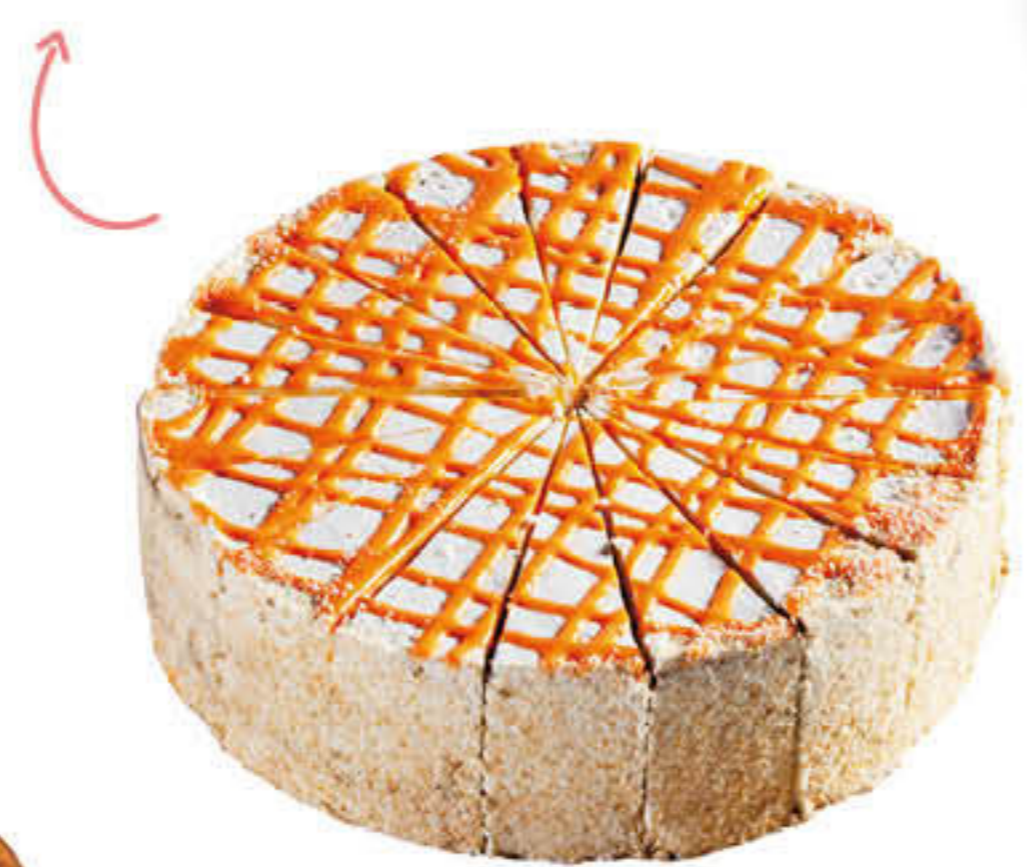
300503 PASTÍS DE FORMATGE AL FORN Pastís de 1.800g 12 racions