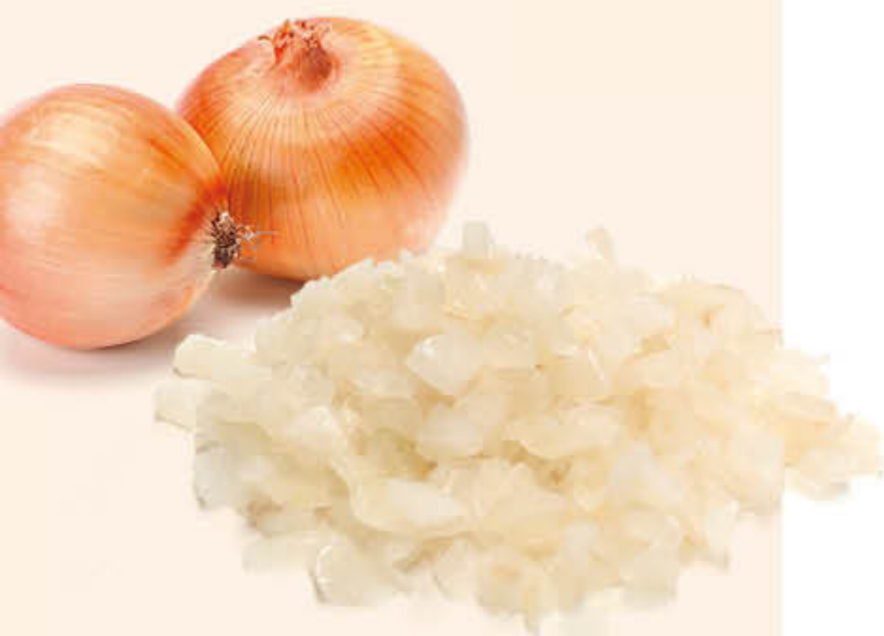
2285 CEBA DAU Caixa de 4 bosses de 2,5kg