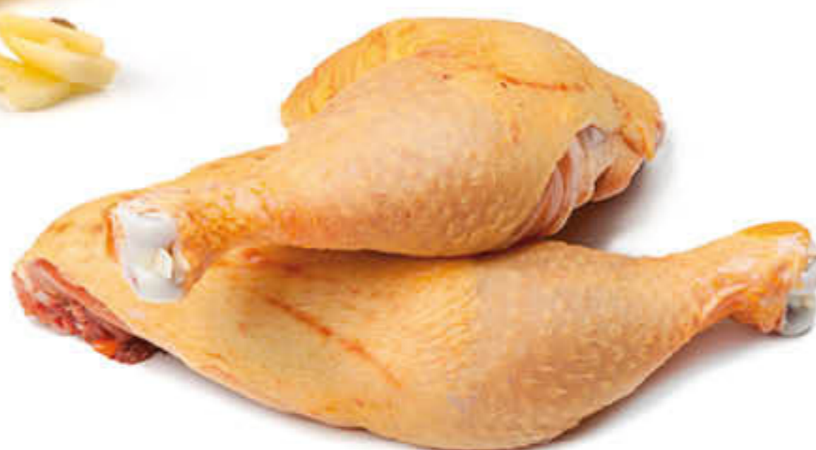
401125 QUART DE POLLASTRE Caixa de 5kg Peces de \pm 300/400g calibrades