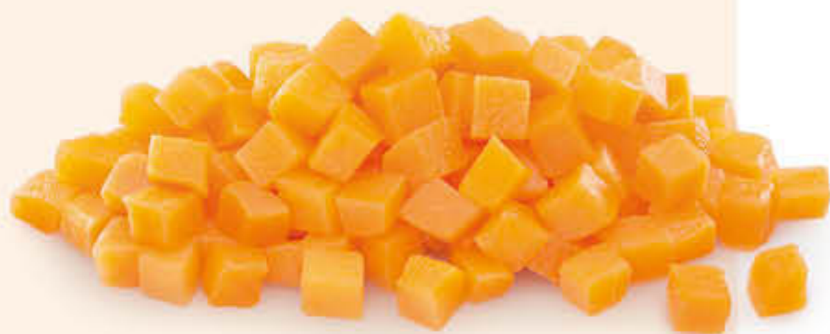
2307 CARBASSA Bossa de 2,5kg