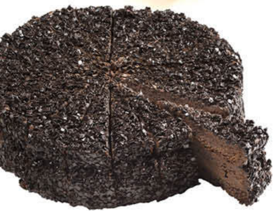
300420 PASTÍS DE MORT PER XOCOLATA Pastís de 2.350g - 18 racions