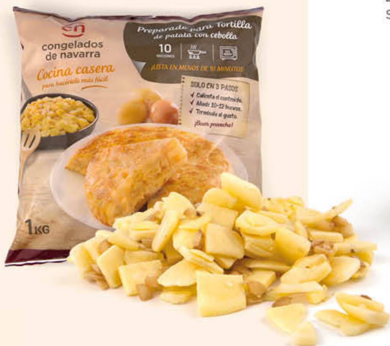
2281 PREPARAT DE TRUITA DE PATATA AMB CEBA Caixa de 5 bosses d'1kg