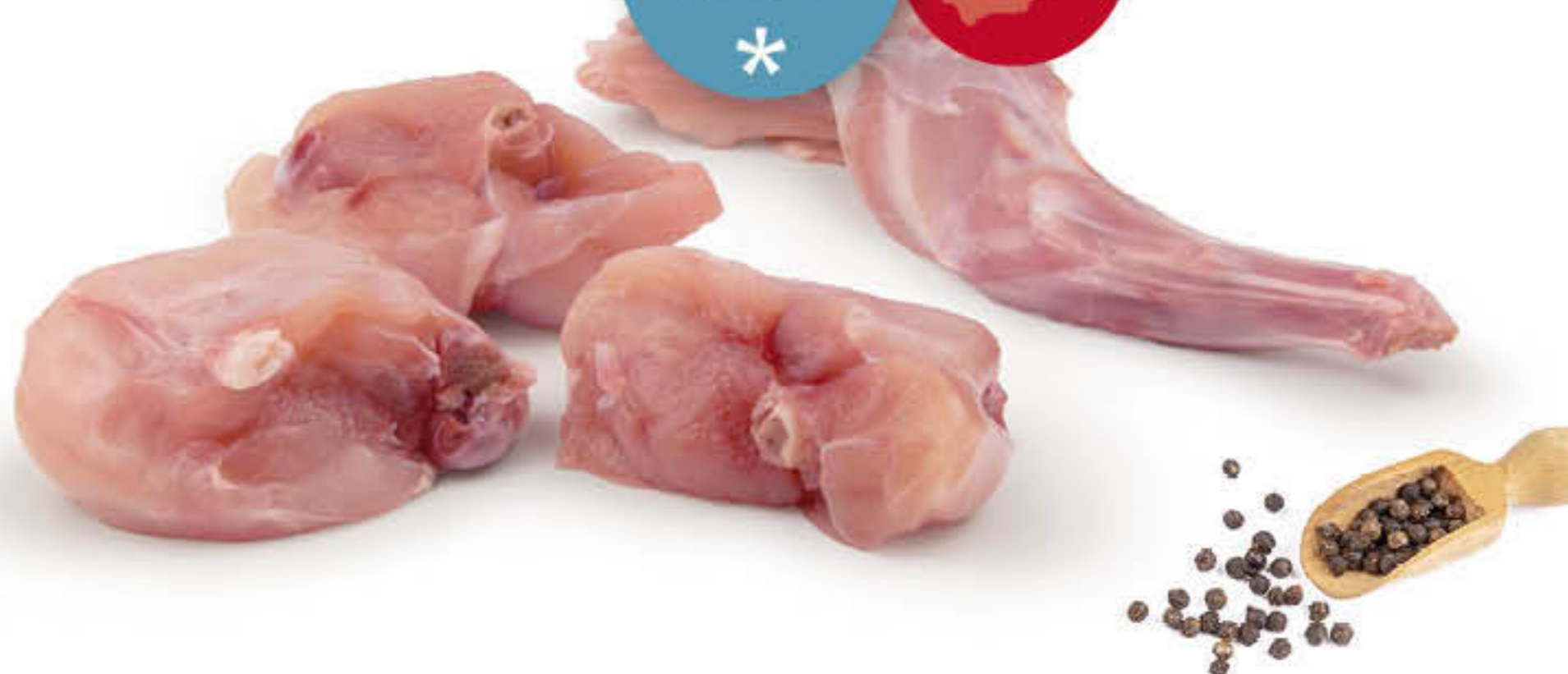
401211U CONILL TROCEJAT Safata de \pm 1kg