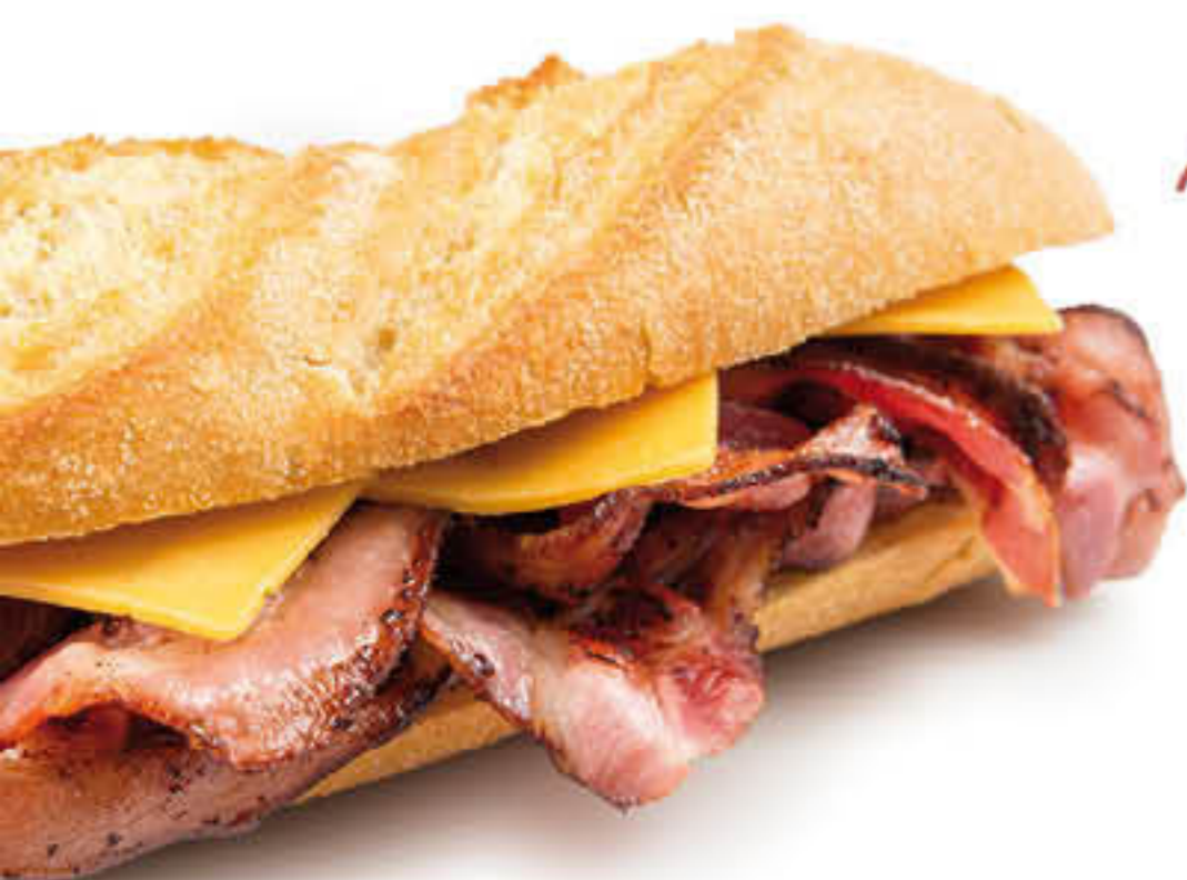
810100 BACON PRÀCTIC Peça de ±4kg