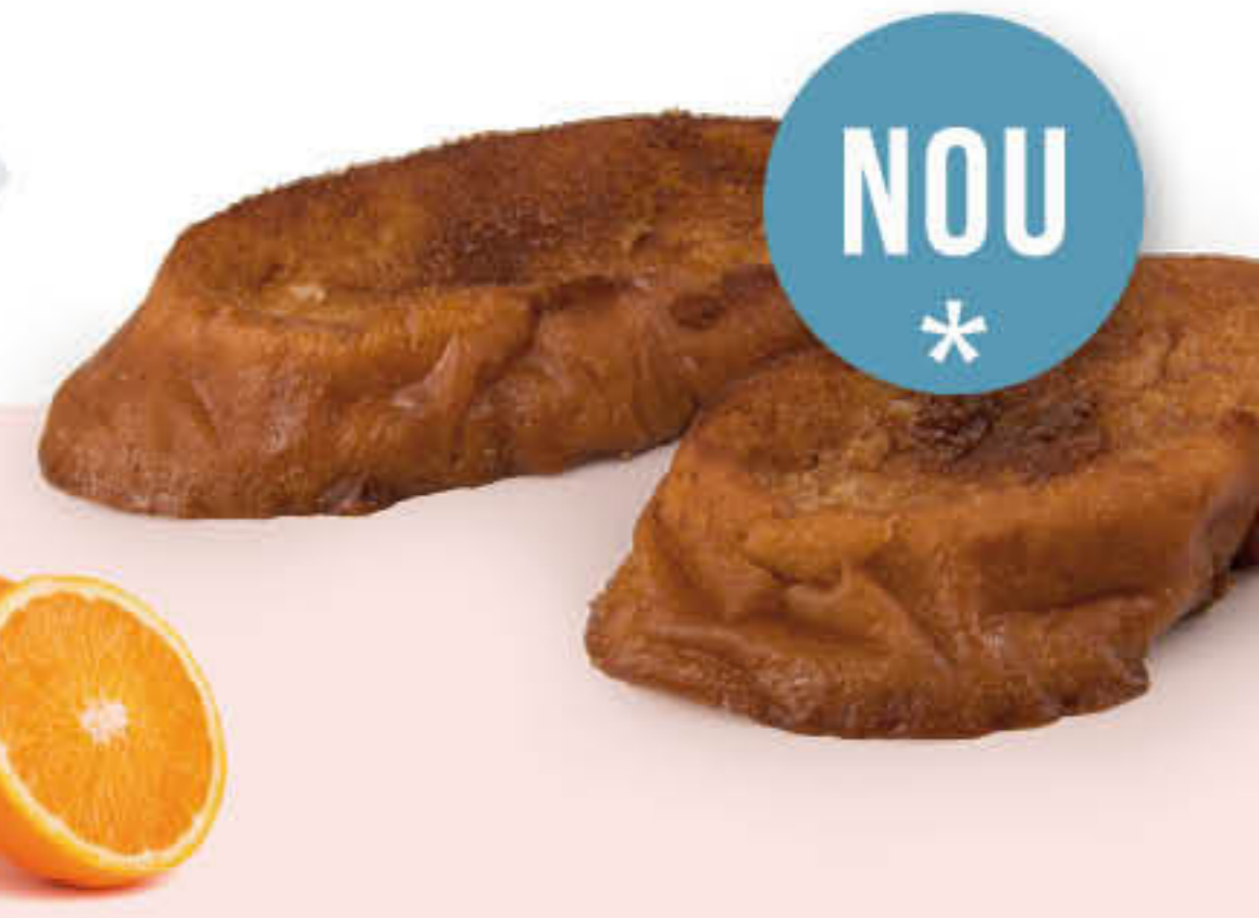
260009U TORRIJAS Safates de ±1,1kg - 6u per safata